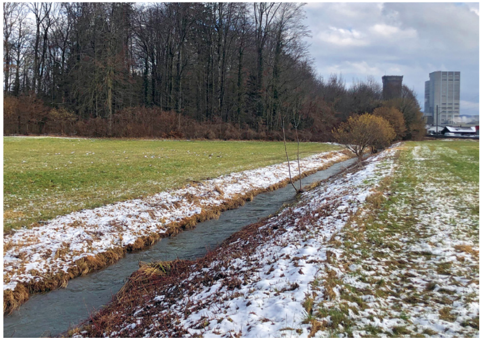
Vorher: Der Rosshänggibach als monotoner Kanal

Autor: Michael Häberli (Fischereinspektorat / Renaturierungsfonds)