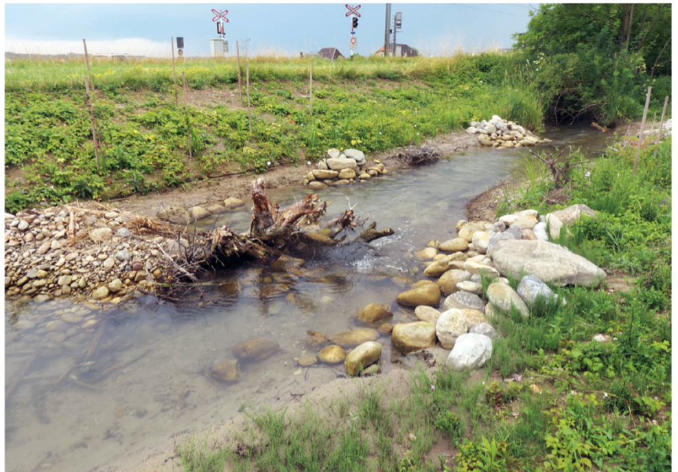
Nachher: Der Rosshänggibach fliesst im Projektabschnitt in einem strukturierten und naturnahen Gerinne