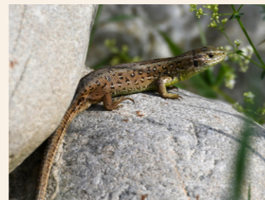
Zauneidechse Lacerta agilis