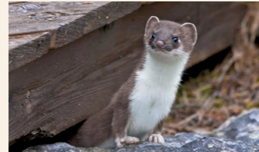
Hermelin Mustela erminea