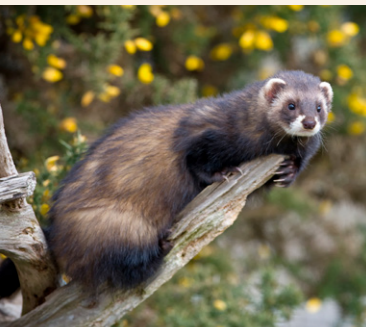
Iltis Mustela putorius