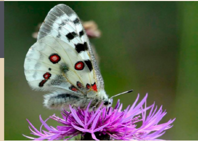
Apollofalter Parnassius apollo