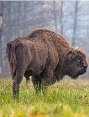
Wisent Bos bonasus