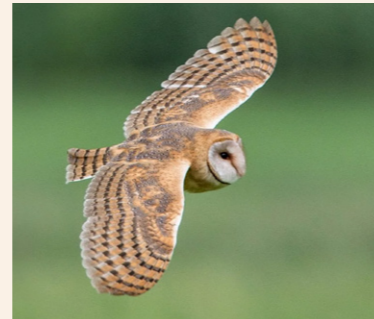
Schleiereule Tyto alba