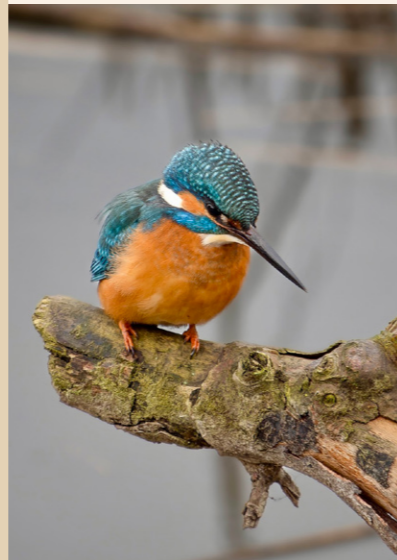
Eisvogel Alcedo atthis