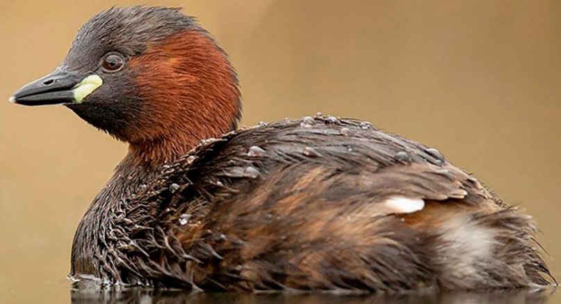
Zwergtaucher Tachybaptus ruficollis – Vogel des Jahres 2024

Wir gehen mit dieser Welt um, als hätten wir noch eine zweite im Kofferraum.