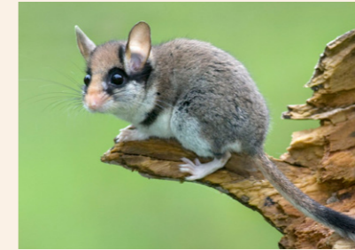
Gartenschläfer Eliomys quercinus

Anmelden bis 1. April bei Edgar Hegner 079 689 40 46, nvb.burgdorf@gmx.ch