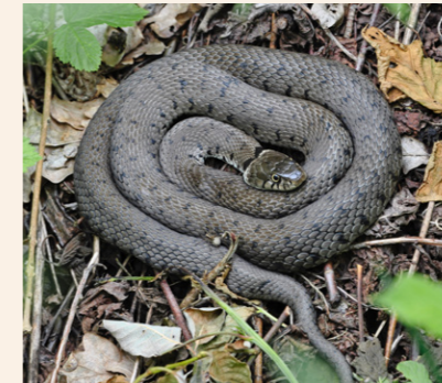
Ringelnatter Natrix helvetica