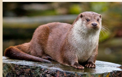
Fischotter Lutra lutra