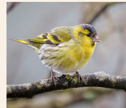
Erlenzeisig Carduelis spinus