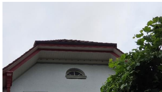
Restaurant da Gino