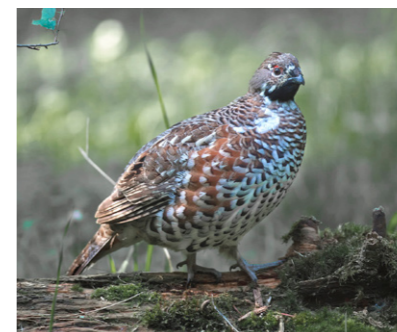
Haselhuhn Männchen Tetrastes bonasia