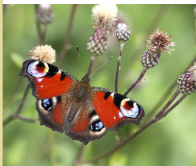
Tagpfauenauge Inachis io