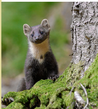
Baummarder Martes martes