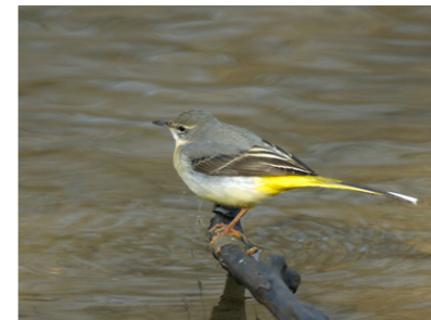
Gebirgsstelze Motacilla cinerea