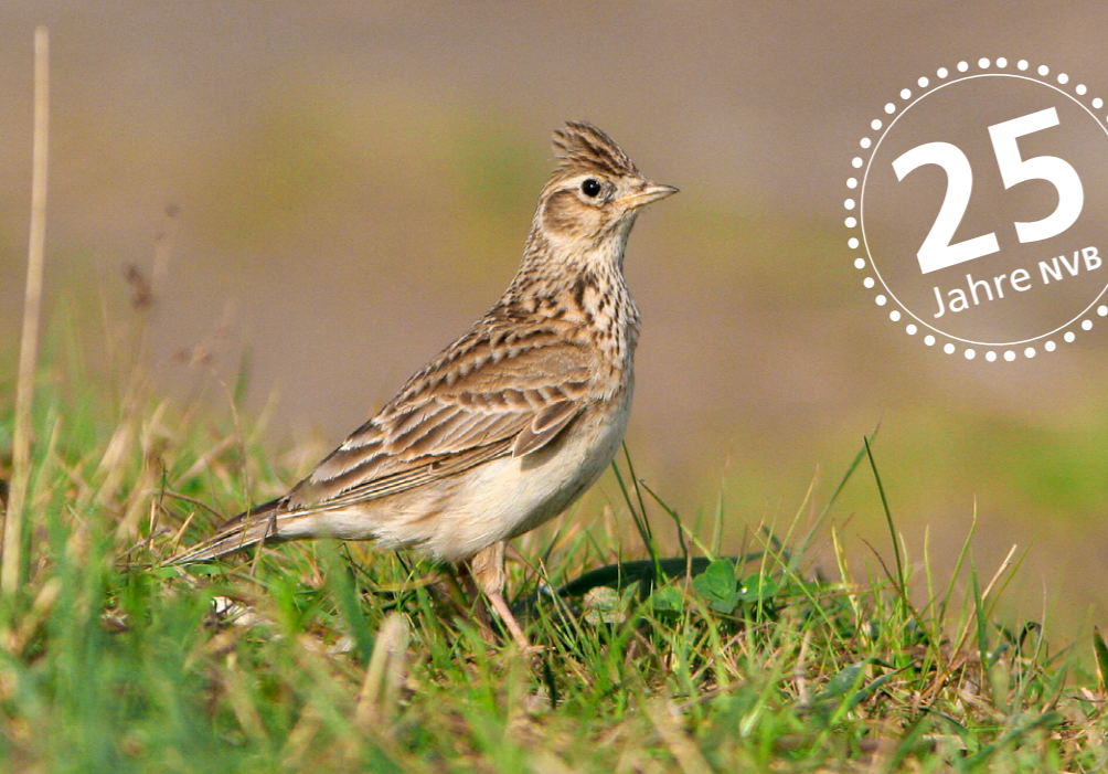
Feldlerche Alauda arvensis Vogel des Jahres 2022

Beurteile einen Tag nicht danach, welche Ernte du am Abend eingefahren hast. Sondern danach, welche Samen du gesät hast.