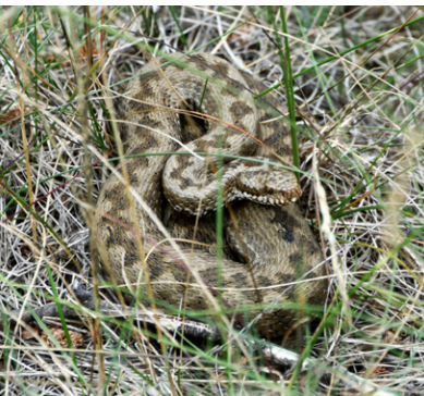
Kreuzotter Vipera berus