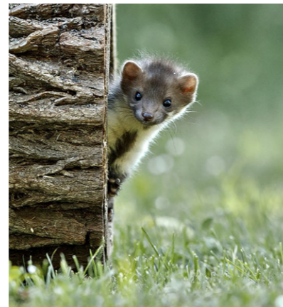
Steinmarder Martes foina