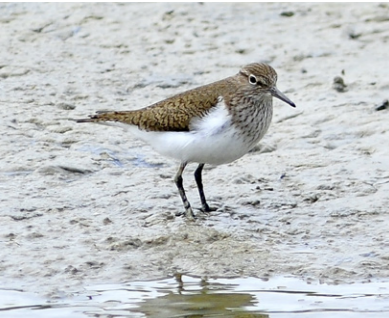
Flussuferläufer Actitis hypoleucos