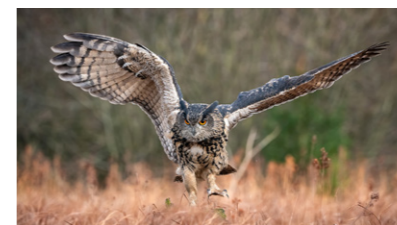
Uhu Bubo bubo