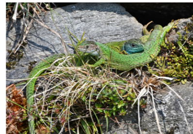
Smaragdeidechse Lacerta bilineata