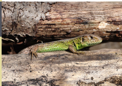
Zauneidechse Männchen Lacerta agilis