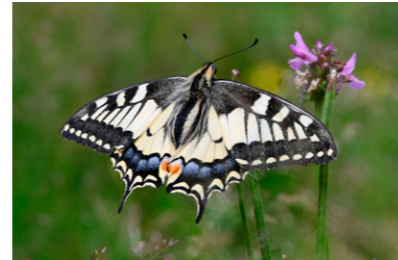
Schwalbenschwanz Papilio machaon

Anmelden bis 3. September bei Iris Baumgartner 079 515 30 18, milvus72@gmx.ch