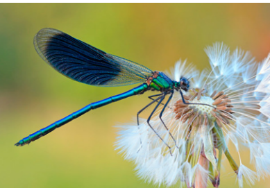
Gebänderte Prachtlibelle Calopteryx splendens