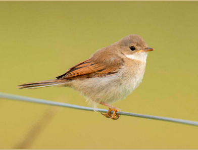
Dorngrasmücke Sylvia communis