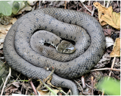
Ringelnatter Natrix natrix