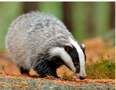
Dachs Meles meles