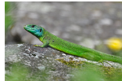
Smaragdeidechse Lacerta bilineata