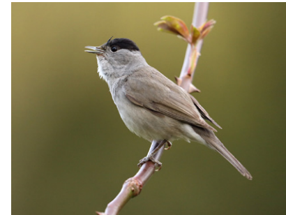
Mönchsgrasmücke Sylvia atricapilla