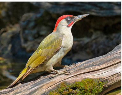
Grünspecht Männchen Picus viridis