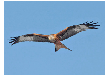
Rotmilan Milvus milvus