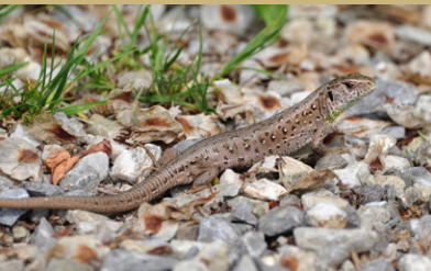
Zauneidechse Lacerta agilis