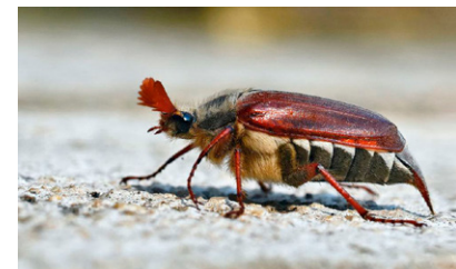
Maikäfer Melolontha melolontha