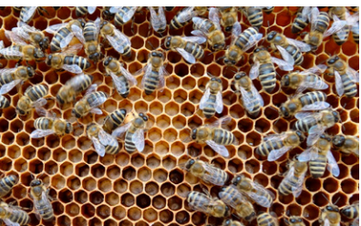
Honigbienen Apis mellifera