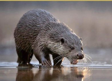
Fischotter Lutra lutra