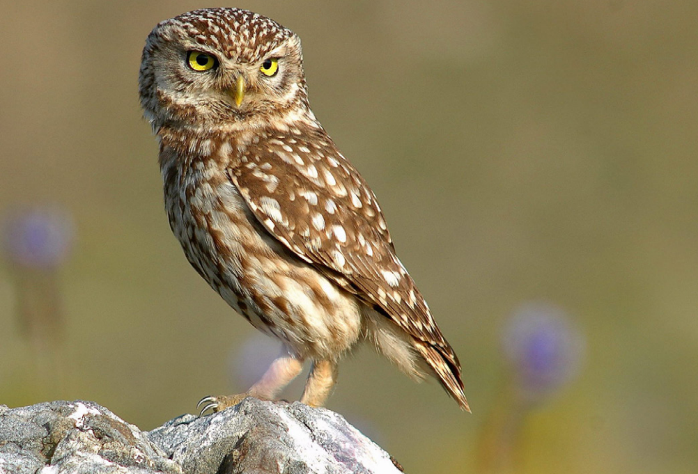
Steinkauz Athene noctua Vogel des Jahres 2021

Sei du selbst die Veränderung, die du dir für diese Welt wünschst.