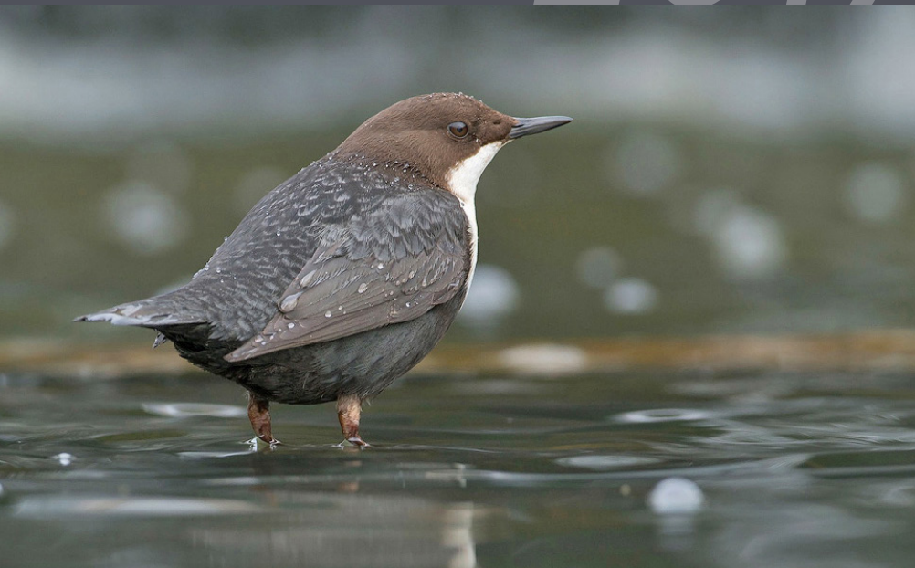
Wasseramsel Cinclus cinclus Vogel des Jahres 2017

Wenn man die Natur liebt, so findet man es überall schön.