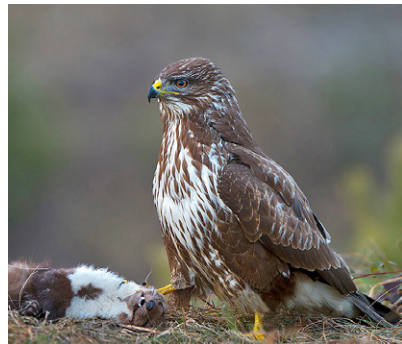
Mäusebussard mit Steinmarder