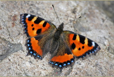
Kleiner Fuchs