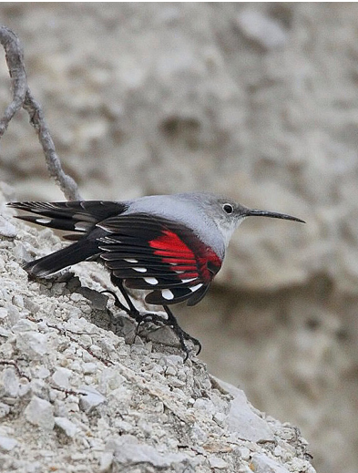
Mauerläufer in Burgdorf