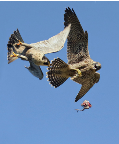
Wanderfalken in Burgdorf